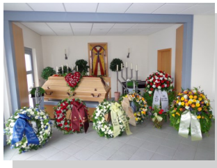
Aufbahrungsdekoration zur Erdbestattung