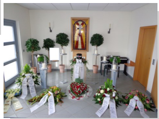
Dekoration zur Urnenbeisetzung

Seit 1899 steht unser Familienbetrieb im Dienste des Lebenden und Verstorbenen.